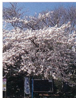
ソメイヨシノ…4月上旬頃 Yoshino cherry: Early April