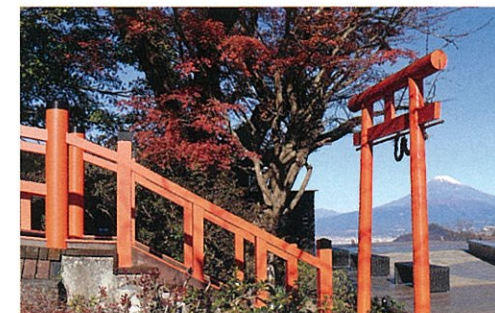
平安時代からの歴史を誇る葛城神社 Katsuragi Shrine, which has a history that can be traced back to the Heian period