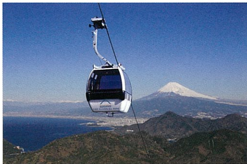
山麓から約7分間の空中散歩が楽しめるロープウェイ Ropeway where you can enjoy an aerial walk for about 7 minutes from the foot of the mountain

Board a ropeway, which takes you in seven minutes to the summit of Mt. Katsuragi at an altitude of 452 meters and take in the dramatic scenery including Mt. Fuji and Suruga Bay on foot. Admire the seasonal flowers on the summit and continue to enjoy a relaxing day in Izu Panorama Park, where fully refurbished restaurants await. The restaurants serve dishes prepared with seasonal ingredients produced in local areas.