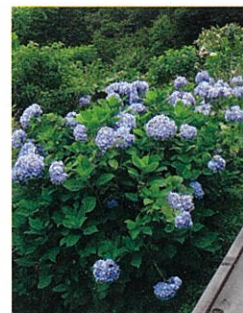
アジサイ…6月頃 Hydrangea: June