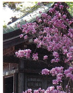
ミツバツツジ…4月中旬頃 Rhododendron dilatatum: Mid-April