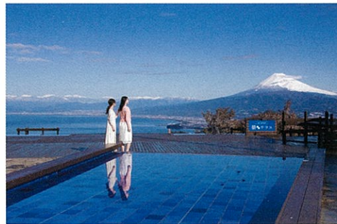
色あざやかなブルーの水盤が広がるパノラマ展望エリア「碧（あお）テラス」 Admire a panoramic view including the blue water of the bay from Ao Terrace.