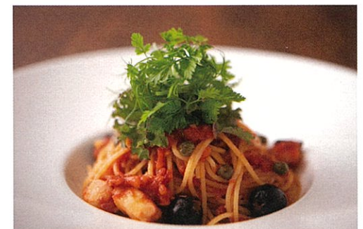
伊豆の旬の食材を使ったグルメ Gourmet dishes prepared with seasonal ingredients produced in Izu.