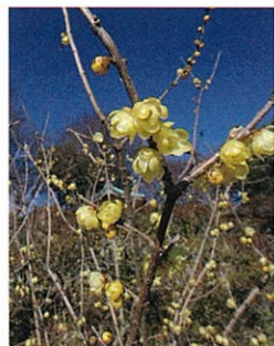
ロウバイ…2月上旬頃 Chimonanthus: Early February

山頂エリアでは四季折々の花がお迎えます。Seasonal flowers await on the summit.