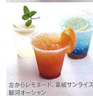
左からレモネード、葛城サンライズ、 駿河オーシャン