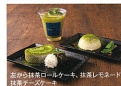
左から抹茶ロールケーキ、抹茶チーズケーキ