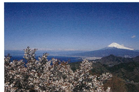
四季の花が楽しめる山頂エリア Admire seasonal flowers on the summit.