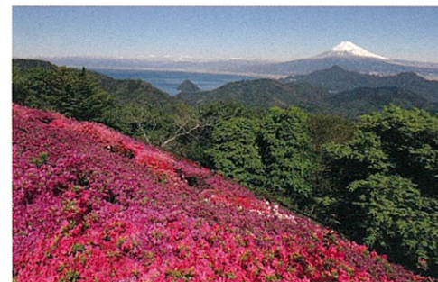
ツツジ…4月中旬頃 Azalea: Mid-April