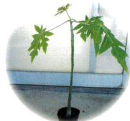
パパイヤの苗（イメージ）