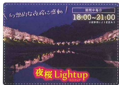
夜桜 Lightup ライトアップ