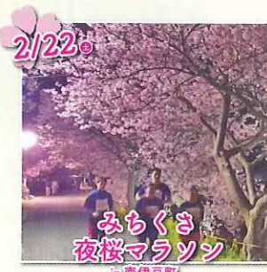
みちくさ 夜桜マラソン in南伊豆町