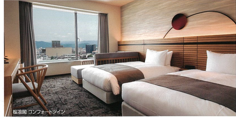
桜凜閣 コンフォートツイン