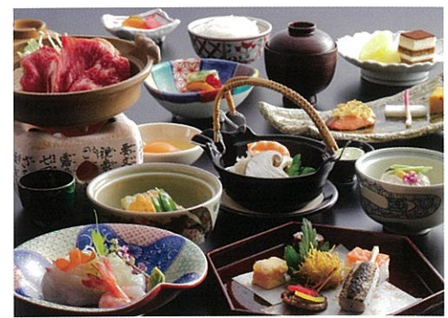
秋のお料理イメージ