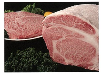
秋のお料理イメージ