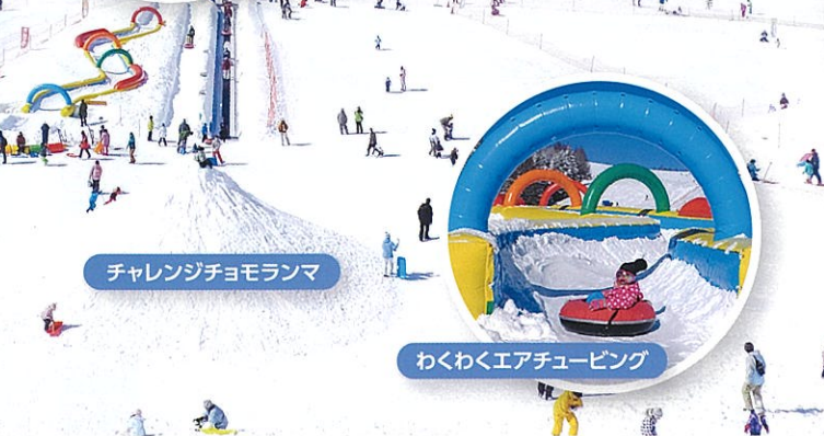
チャレンジチョモランマ