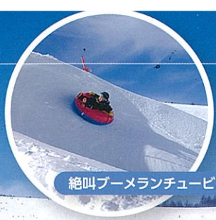
絶叫ブーメランチュービング