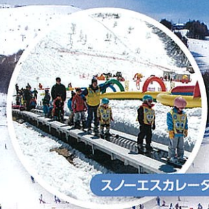
スノーエスカレーター