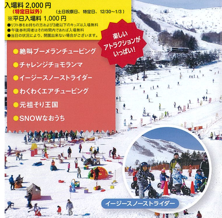
イージースノースライダー