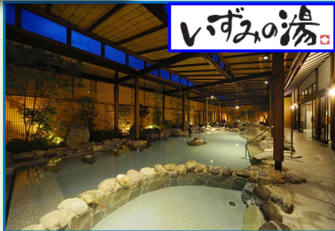
(地域最大級の露天風呂)