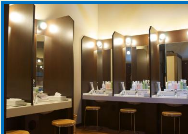
(アメニティの整った洗面台)