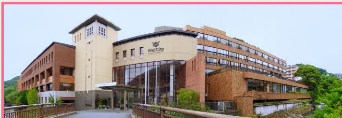
施設全景(ホテル 大小宴会場 休憩室 売店 レストラン)