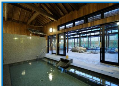
(内風呂より見た露天風呂)