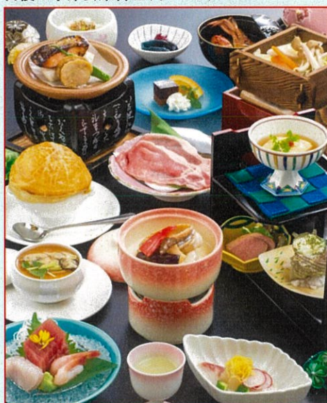
湯河原最大級の露天風呂 いずみの湯