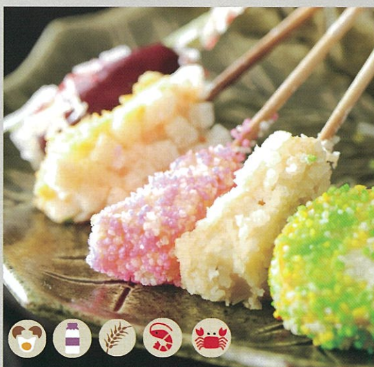
ひびき野名物 五四季揚げ