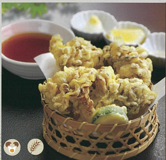
群馬の名産 舞茸の天婦羅