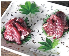
お試しジビエ (鹿・猪各1枚)