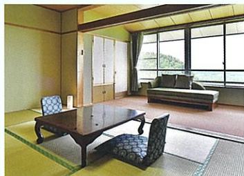
和室 10畳 +6畳