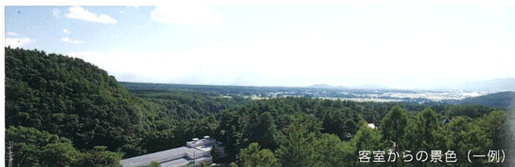
客室からの景色（一例）

Wifi 無料・テレビ・バス・トイレ・冷蔵庫・冷暖房・ バスタオル・ハンドタオル・歯ブラシ・石けん・浴衣・ポット