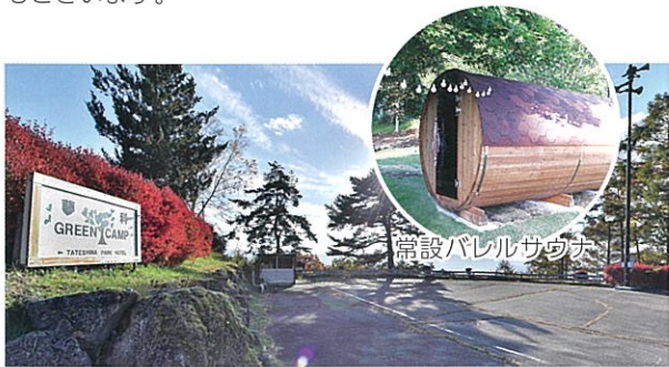
[蓼科グリーンキャンプ RVパーク]

太い柱と梁が落ち着いた情緒を醸す昔ながらの佇まい、心まで温かくしてくれそうな炭火が燃える囲炉裏端。