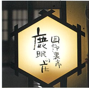
[いろいろ亭 鹿眠の庄]

アルプスと八ヶ岳の山並を一望できる、当館の中でも一番景色のいいロビー。キッズスペース、お土産処などもございます。