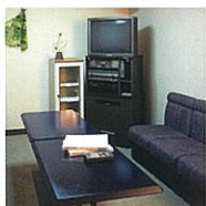
カラオケ・クラブ