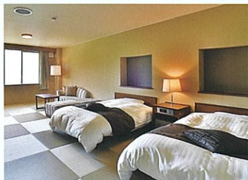
和室ベッドツイン