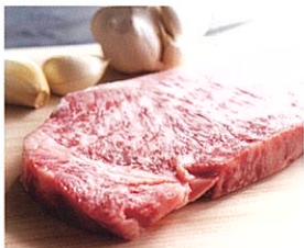
信州アルプス牛ステーキ