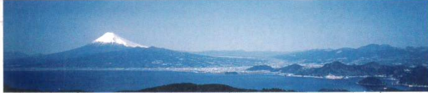
逢磨山からの展望。(修善寺温泉から車で15分)

昭和14年に開催されたニューヨーク万国博へ、日本政府よりここから撮影した高さ8.2m、巾32.7m(268.14㎡)に及ぶ大パノラマ写真が出品され、大賞牌を博した。これは日本の代表的な景色である富士山を、世界に紹介するため企画されたもので、当時指名を受けた六楹社(現コニカミノルタ)の技師が、駿河、甲州、信州など、富士山回りを一巡し、適地を探した結果、この連峰山を選んだといわれています。駿河湾を前景に、左に南アルプス、右に箱根連山を従えた大パノラマは、まさに「日本一の展望地」といえます。