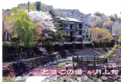
とつこの湯 4月上旬