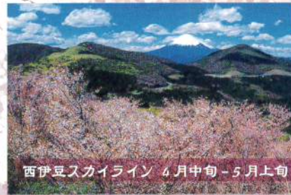
西伊豆スカイライン 4月中旬-5月上旬