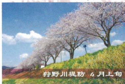
狩野川堤防 4月上旬