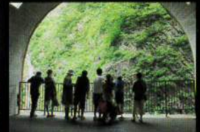
第2見晴所 入坑口から約18分