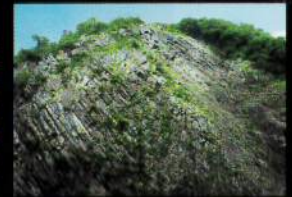
第3見晴所の屏風岩 入坑口から約20分