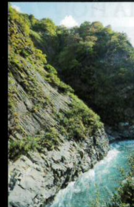
第1見晴所からの眺望 入坑口から約15分