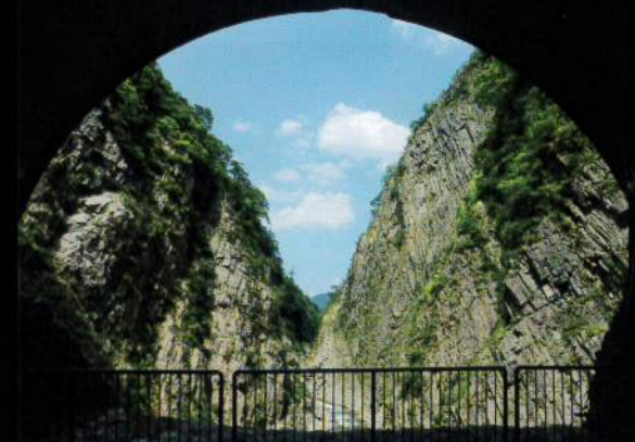
パノラマステーションからの眺め 入坑口から約30分 トンネルの終点で、雄大な峡谷美を満喫できる最高のビュースポット。無料望遠鏡もあります。