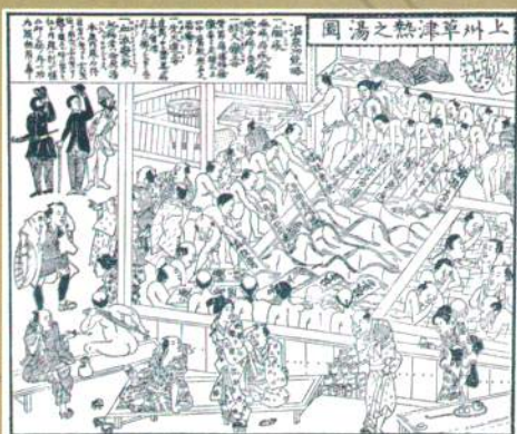
時間湯の版画(明治初年)湯もみ板には、全国各地より訪れる人々の出身地・名前等が記されている。