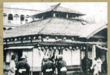
明治時代の熱乃湯の外観。昭和43年、共同浴場から観光施設に。伝統の湯もみと踊りを今に伝える。