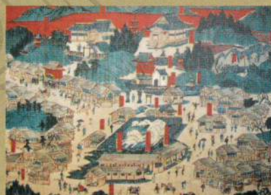
湯畑を中心に描かれた絵。江戸時代のにぎやかな様子がかがえる。