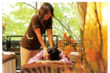
オリエンタルタッチケア