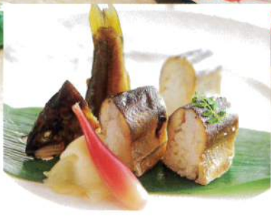
鮭寿司 鮭の上品な味が お楽しみいただけます。