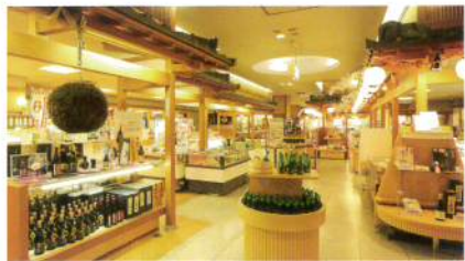
お土産処「花かんざし」