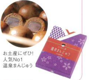
お土産にぜひ! 人気No1 温泉まんじゅう