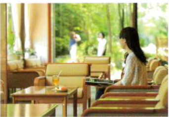
コーヒーラウンジ「ジャルダン」