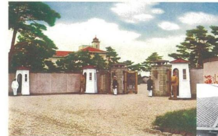
那須御用邸正門（戦前）