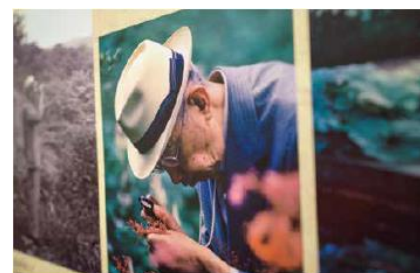
那須を愛し、 自然を慈しまれた 昭和天皇

ロイヤルリゾート・ 那須御用邸で 自然観察トレッキング かつて人は森に憩い、 森の恵みを受けてきた。 関東の北に広がる 高原の春を行けば、 そんなはるかな記憶が よみがえってきそうだ。 薫風に誘われて、 血室にゆかり深い 花盛りの森を歩く。 松本正史 著 | X text by Masataka Yamamoto 那須町