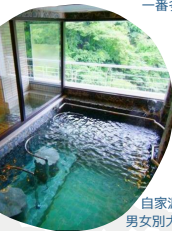
自家源泉100%の温泉 男女別大浴場、半露天風呂