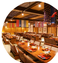
昼ダイニング宴会一例 最大120名まで可能