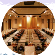
和室一例 和室の場合は最大160名まで可能