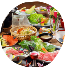
1泊2食付き 一番人気の「鬼怒大御膳」一例