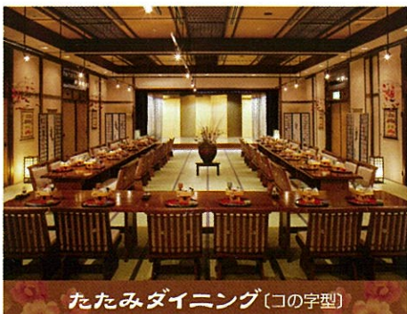
たたみダイニング〔コの字型〕

まごころ仕様になりました。 一心館の選べるご宴会会場 畳の間にゆったりとしたテーブル席を設け 故郷の彩りを散りばめました。 これなら、浴衣の裾を気にすることもなく 正座が苦手な方でも大丈夫。 美味しいお料理を味わいながら 皆様と一緒に 和やかな時をお楽しみください。