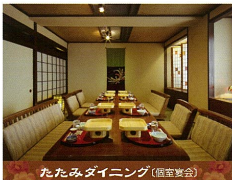
たたみダイニング〔個室宴会〕

緞帳付舞台を取り囲むよう〔コの字型〕にセッティングすることも可能です。日舞やカラオケの発表会、内輪でのご披露宴などにご利用ください。