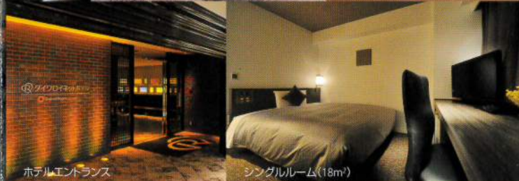
ホテルエントランス