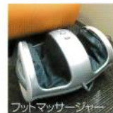
フットマッサージャー