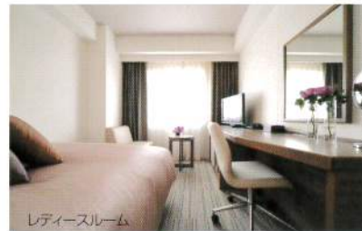
レディースルーム