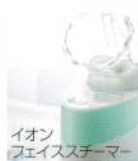
イオンフェイススチーマー