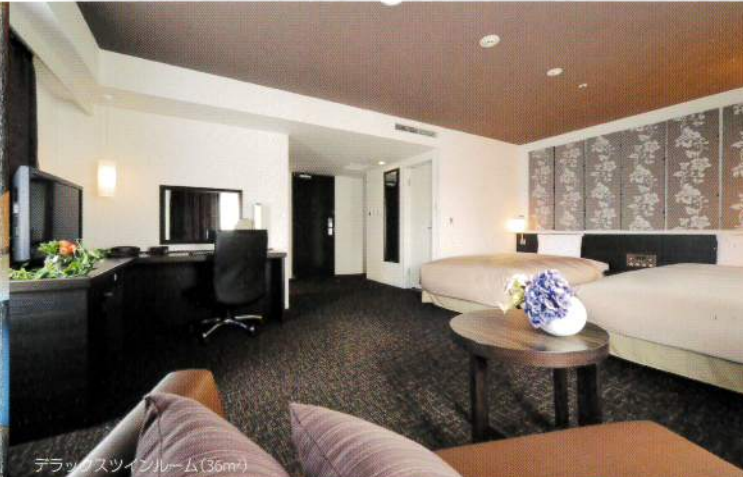
デラックスツインルーム(35㎡)