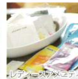
レディースアメニティ