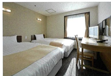
ツインルーム / Twin Room