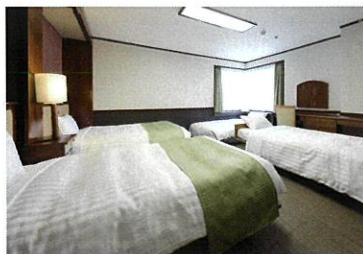
フォースルーム / Forth Room