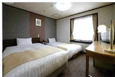
スタジオツインルーム / Studio Twin Room