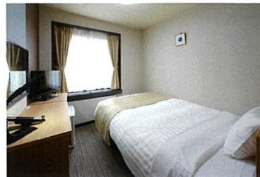
シングルルーム / Single Room

江戸町情緒の香りと、日本一の問屋街の活気を残す浅草橋。眼下の屋形船が浮かぶ神田川畔に構えるベルmontホテルは、情緒溢れる静けさの中で、落ち着いた雰囲気醸し出します。上野駅、東京駅、羽田空港の玄関口から、浅草、上野はもちろん、副都心新宿お台場へのレジャースポットへ、便利なアクセス。ビジネス、観光の拠点として、是非ご利用下さい。